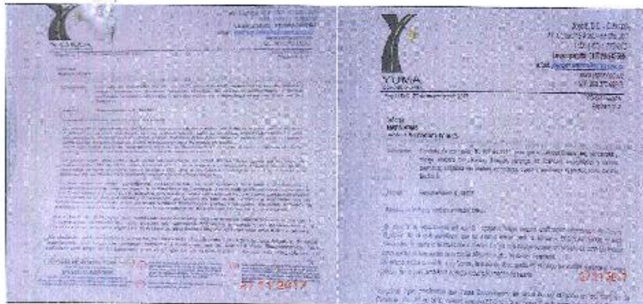
EDICTOS DE LA R_18172 YC-CRT-62815